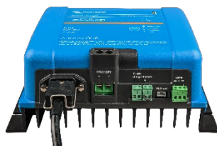
Smart IP43-acculader 12/50 (1 + 1)