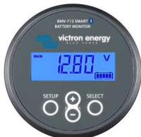
Bluetooth bespeuren: BMV-712 Smart-accu monitor