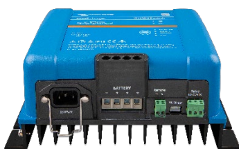
Smart IP43-acculader 12/50 (3)