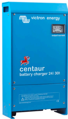
Centaur Lader 24 30