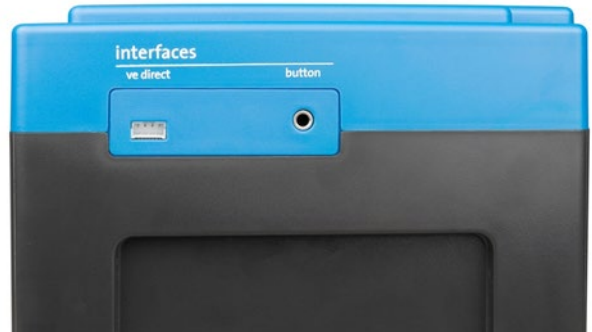
VE.Direct en drukknop