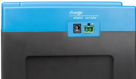
Adapter en ingang auto/zonnepaneel (contrastekker voor de auto/zonnepaneel ingang wordt)