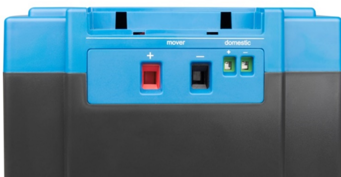
Hoog vermogen uitgang (mover) en laag vermogen uitgang (domestic)