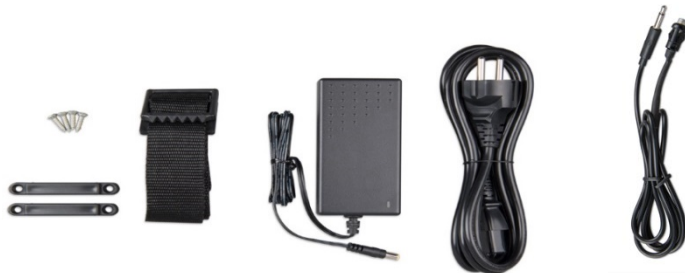
Bevestigingsband Adapter Netsnoer Drukknop met kabel (2 m) en twee kleuren LED